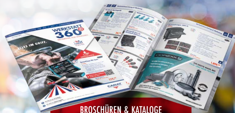
BROSCHÜREN & KATALOGE